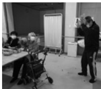
もう、カンベンして〜

デイサービスでは、2月、豆まきと鍋週間を実施しました。豆まきでは、表紙にもありますように、スタッフが入れ替わり立ち替わりで鬼になり、利用者の皆さん手づくりの、あたたかでも痛くない豆(?)をたくさん浴びていました。利用者の方々は、「福は内!、鬼は外!」と、コロナ退散も願って元気よく豆をまき、「気持ちよかったです」「すっきりしたねえ」と感想を話していらっしやいました。鍋週間では、写真にもありますように、利用者お一人お一人に鍋料理を食べてもらいました。宴席などにあるような固形燃料で火を通す鍋を使用し、材料も