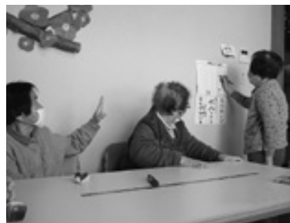
私は、これがいいな

ミニデイサービスでは、日頃利用者の皆さんの自主性を尊重しながら運動やレクリエーションなどを通して、機能の向上を応援しています。