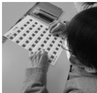
さあ、何処まで行ったかな

り入れながら、脳トレも行っていきます。大系線沿線の旅は、大系線の各駅を目標に設定し、それぞれ往復を目指してまわっていき(ゆうあい館の廊下)を歩くもので、転倒防止のための