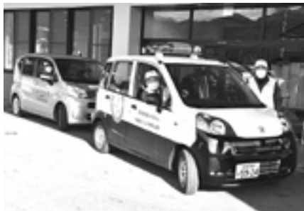
青色回転灯 パトロール ボランティア