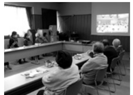
介護者交流会（保育園児とビデオ交流）