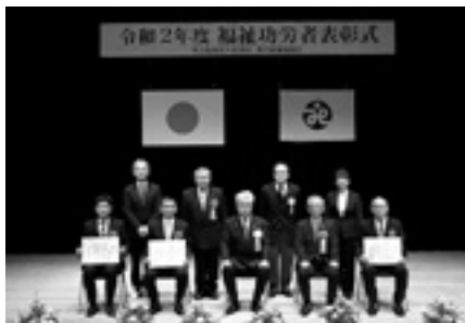
社会福祉協議会 福祉功労者表彰