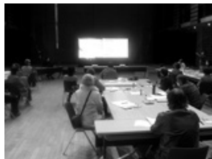
地区ふれあいサミット